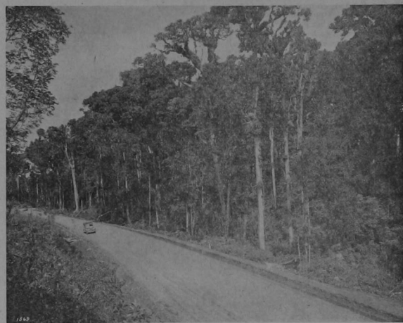
Admirable vista del bosque de robles de la carretera interamericana, que es una riqueza nacional de los costarricenses la que, sin embargo, ya está convirtiendo el jefe de acción de la oposición en durmientes de ferrocarril, como forma de llenarse los bolsillos y de "salvar" nuestro pueblo

La construcción de la carretera interamericana—decidida por los Estados Unidos—obligó al gobierno del doctor Calderón Guardia a hacer un desembolso que no estaba previsto. La suma de dinero que su gobierno dió como contribución para la construcción de esa vía en nuestro territorio, se proclama por la oposición que el "viento se la llevó". Como se dice del millón de colones que Calderón Guardia dió para la Universidad Nacional; como se dice del millón y medio de colones con que Calderón Guardia echó a andar la ley de precios mínimos que ha multiplicado nuestra producción; como se dice de los 14 millones que destinó Calderón Guardia a la construcción de la red de carreteras tributarias.