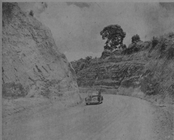
Un hermoso corte de la carretera interamericana, al sur de Cartago, obra impuesta por las necesidades de la guerra y la economía en la cual Calderón Guardia invirtió 14 millones de colones que no se los ha llevado el viento. Que están allí, sirviéndole a millares de costarricenses

(Los 14 millones que dió el gobierno de Calderón Guardia como contribución para la construcción de esa vía se hacen aparecer como si el viento se los hubiese llevado)